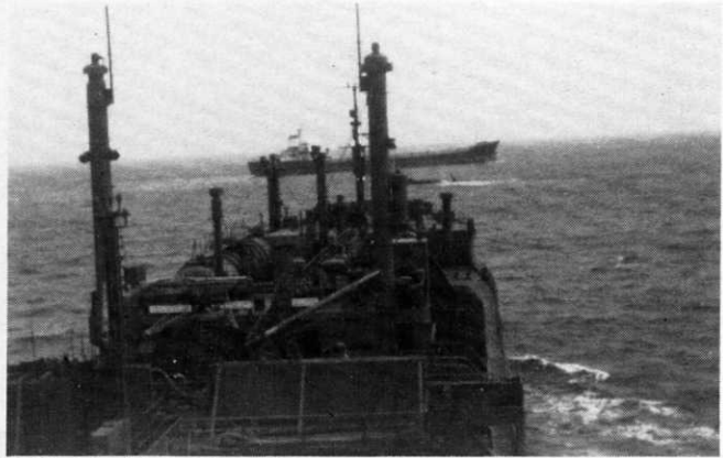
Et libyisk skip holdt på å kutte slepewiren til M/T «Orkanger».

Lørdag 27. mars ankret vi opp på redan utenfor Pireus for å vente på dagslys og to nye taubåter som skulle ta oss til Skaramanga. Mandag formiddag 29. mars dokket vi inn, og siden trai-